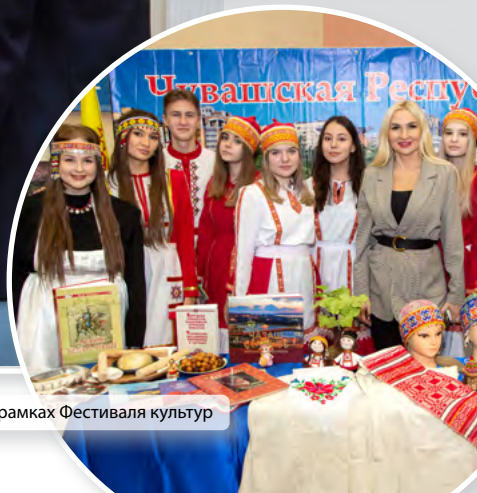
Выставка народов мира в рамках Фестиваля культур