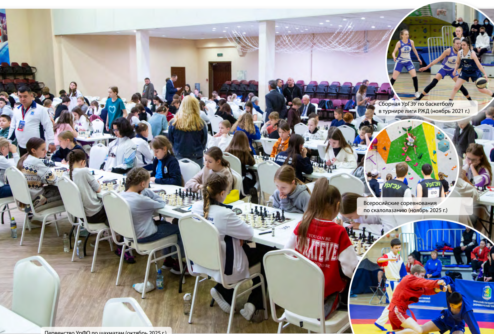
Сборная УрГЭУ по баскетболу в турнире лиги РЖД (ноябрь 2021 г.)