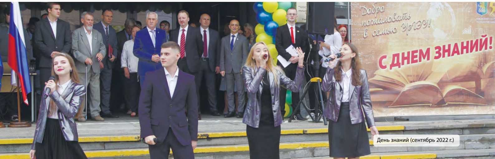
День знаний (сентябрь 2022 г.)