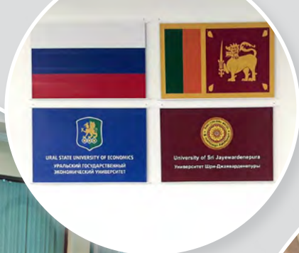
Студенты из Шри-Ланки прошли обучение русскому языку в УрГЭУ