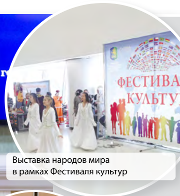
Выставка народов мира в рамках Фестиваля культур