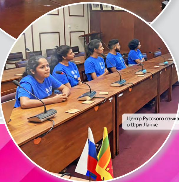
Центр Русского языка УрГЭУ в Шри-Ланке