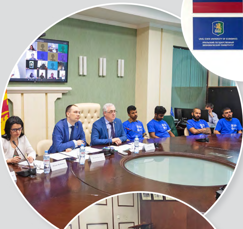
Центр Русского языка УрГЭУ в Шри-Ланке