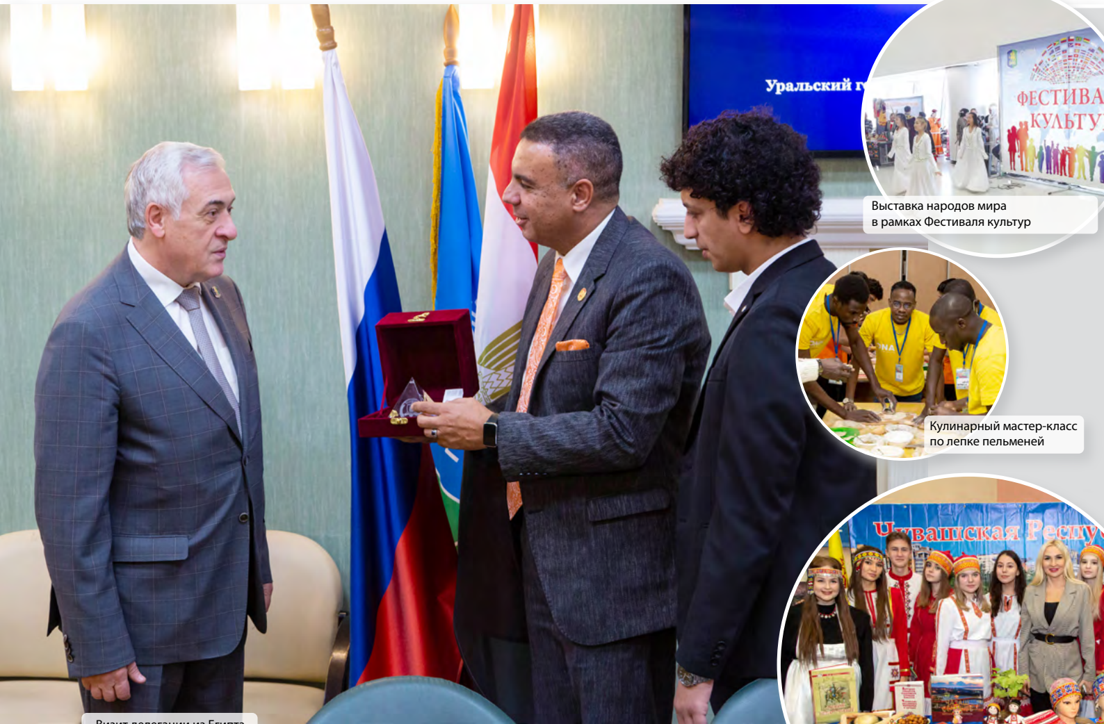
Визит делегации из Египта