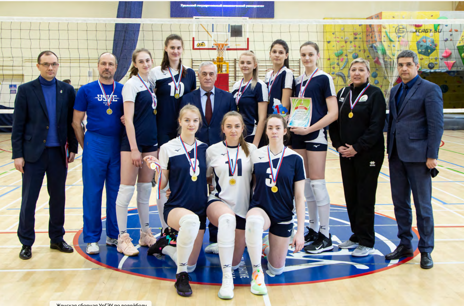
Женская сборная УрГЭУ по волейболу