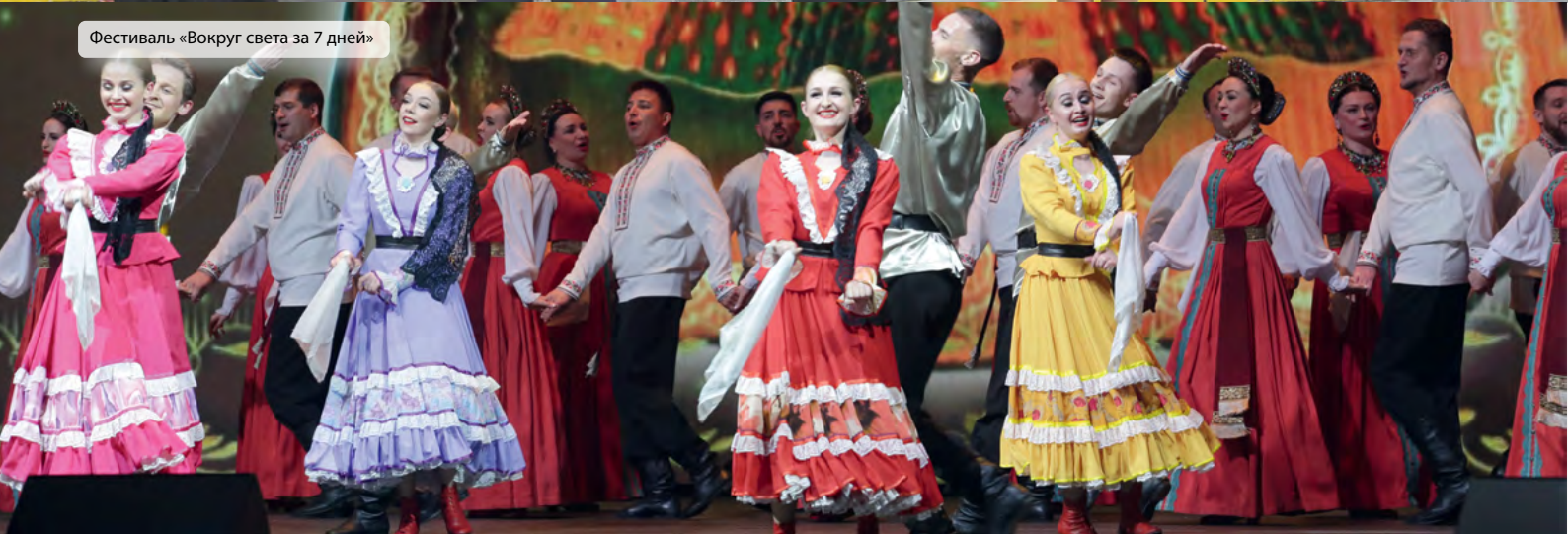
Фестиваль «Вокруг света за 7 дней»