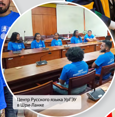
Центр Русского языка УргЭУ в Шри-Ланке