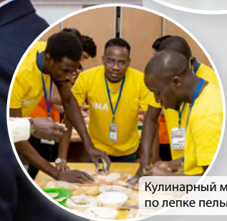
Кулинарный мастер-класс по лепке пельменей